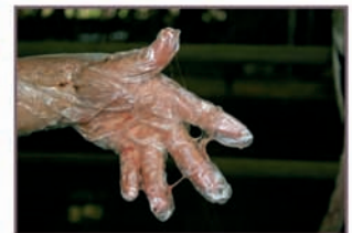
4. Detalle de la viscosidad lograda.

2. Truco del veterinario: siempre, pero especialmente en partos secos (vacas, yeguas y ovejas), ayuda mucho mezclar el polvo con agua previamente. Es genial para yeguas, que suelen ser de parto muy seco.