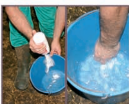
1. Seis golpes de polvo en un pequeño balde lleno de agua y mezclar.

3. Truco del veterinario: usar la bomba para extraer fetos momificados o pegados. Vacas y yeguas.