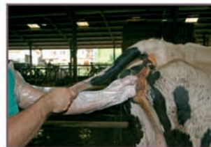
3. Introducir la mano en la vagina del animal posibilitando la mezcla del polvo con los flujos.