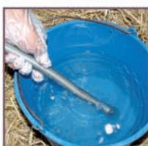
2. Mojar la punta de la bomba en la mezcla.