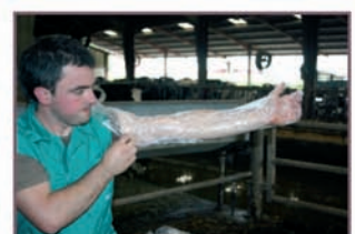
5. Proceder como en los ejemplos previos: guante, polvo, introducir mano y trabajar dentro del animal.