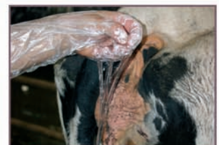
4. Introducir el brazo. Detalle de la viscosidad lograda.

3. Truco del veterinario: usar la bomba para extraer fetos momificados o pegados. Vacas y yeguas.