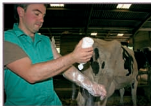
2. Dos golpes de polvo sobre el guante.