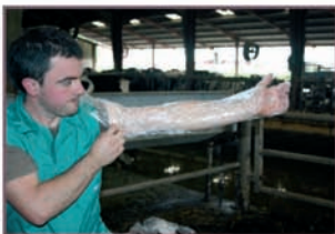
1. Colocarse el guante.

1. Uso directo del polvo sobre el guante. Vacas, yeguas, ovejas.