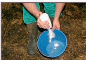
1. Dos golpes de polvo en medio litro aproximado de agua.

2. Truco del veterinario: siempre, pero especialmente en partos secos (vacas, yeguas y ovejas), ayuda mucho mezclar el polvo con agua previamente. Es genial para yeguas, que suelen ser de parto muy seco.