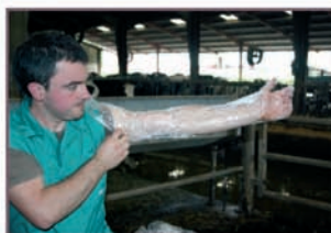
2. Colocarse el guante.