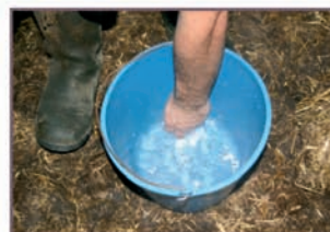
3. Mezclar el polvo con el agua.